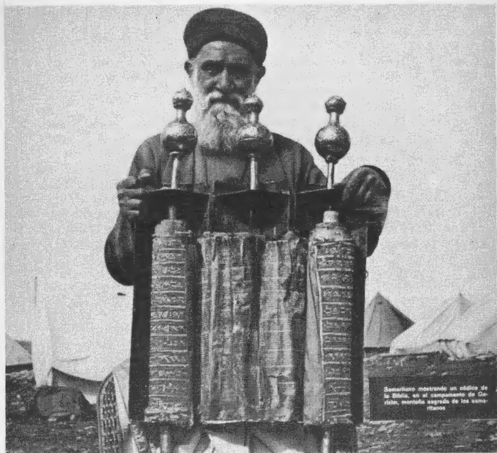
Samaritano mostrando un códice de la Biblia, en el campamento de Gázán, montaña sagrada de los samaritanos.