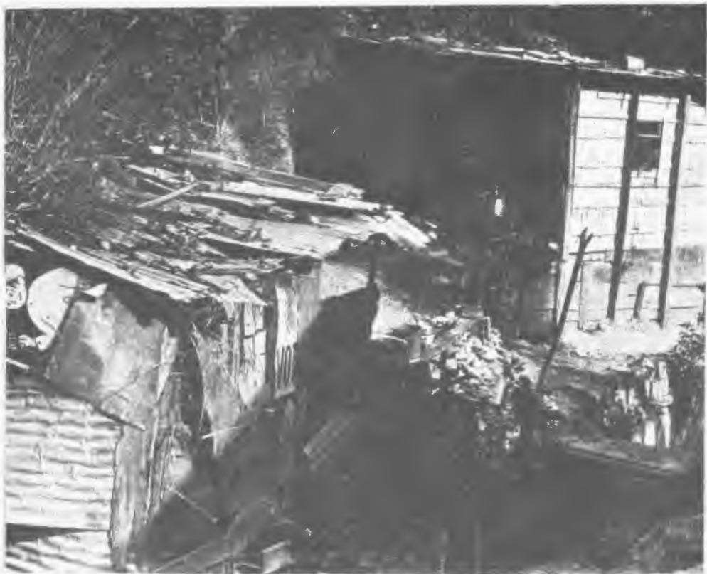
Muestra clásica del rancho urbano

No como bandera y plataforma de una parcialidad política, sino como consigna de movilización general de todos los venezolanos en un tenaz y solidario esfuerzo de supermovilización general de todos los venezolanos en un tenaz y solidario esfuerzo de superación colectiva". (ARTURO USLAR PIETRI: ¿Tiene un porvenir la Juventud Venezolana? Suplemento de El Nacional).