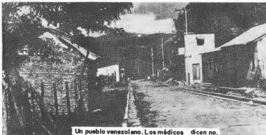
Un pueblo venezolano. Los médicos dicen no.

(2) Porcentaje sobre mortalidad general.