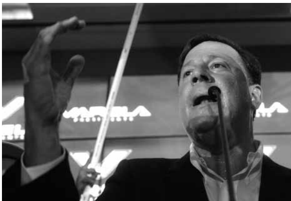
Juan Carlos Varela, presidente electo de Panamá.