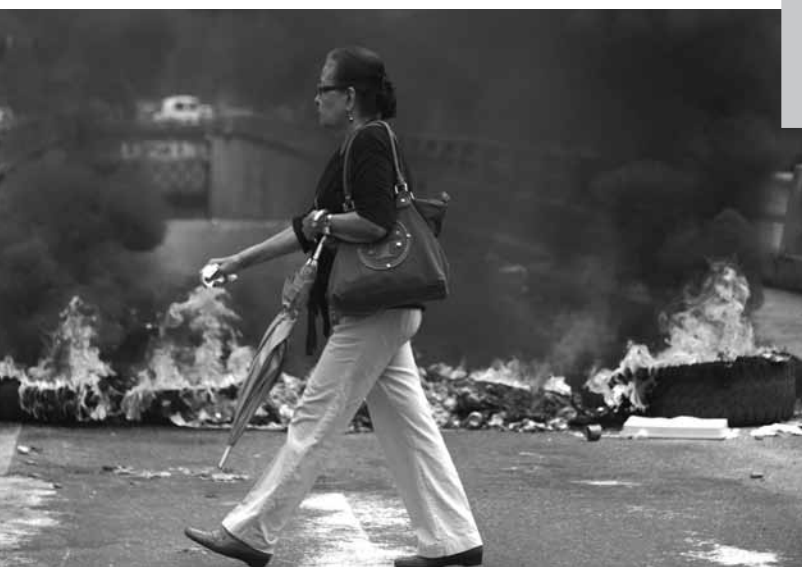
LA VOZ DE HOUSTON

¿Qué han supuesto estos meses de conflictividad para la dinámica económica? Es una de las interrogantes que pretende responder este trabajo a través de un breve balance de lo que ha ocurrido en este primer semestre del año