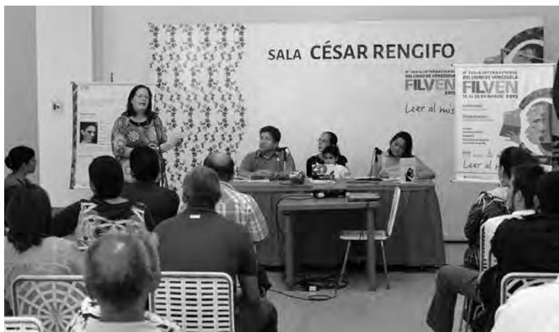
LA CASA DE BELLO

a Feria Internacional del Libro de Venezuela (Filven), realizada en Caracas (del 12 al 22 de marzo de 2015) y anunciada con leer al mismo son , fue dedicada este año a César Rengifo 1 y como país invitado tuvo a Puerto Rico.