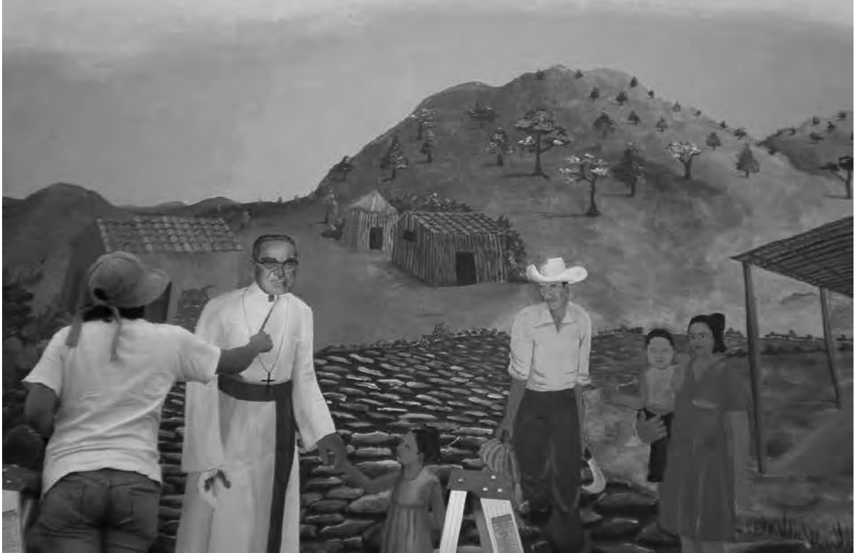
WALLS OF HOPE