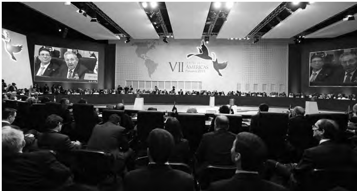
PRESIDENCIA DE LA REPÚBLICA DE ECUADOR

de las dos Américas, por su parte, se han reunido para ratificar su anhelo de un consenso que desde ahora incluya a Cuba y cuente con una Venezuela más tranquila.