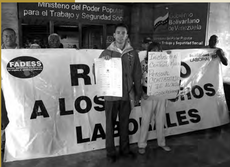
PRENSA DE SOLIDARIDAD

*Coordinador de investigación de Provea.