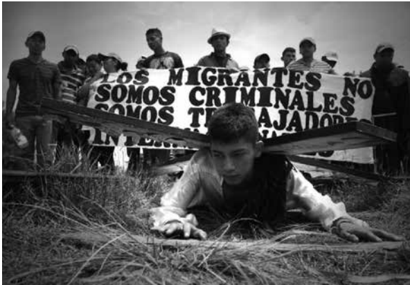
THE SOCIAL SCIENCE POST

enfrentó la crisis de la deuda soberana de Grecia, país miembro de la zona monetaria del euro, cuyo default amenazaba la solidez financiera del bloque regional en su conjunto. Los debates acerca de cómo manejar la crisis fiscal griega causaron grietas entre los diversos estados nacionales miembros de la UE y fortalecieron tendencias separatistas y radicales.