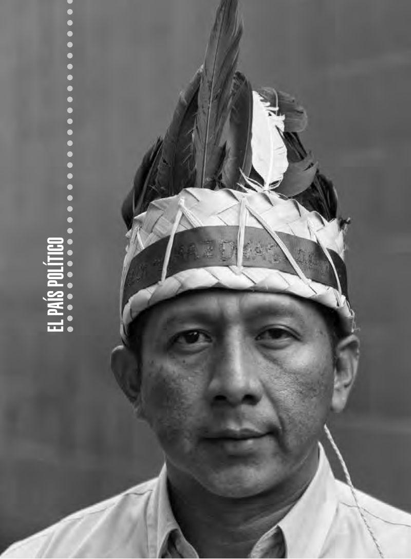
Romel Guzamana, diputado indígena