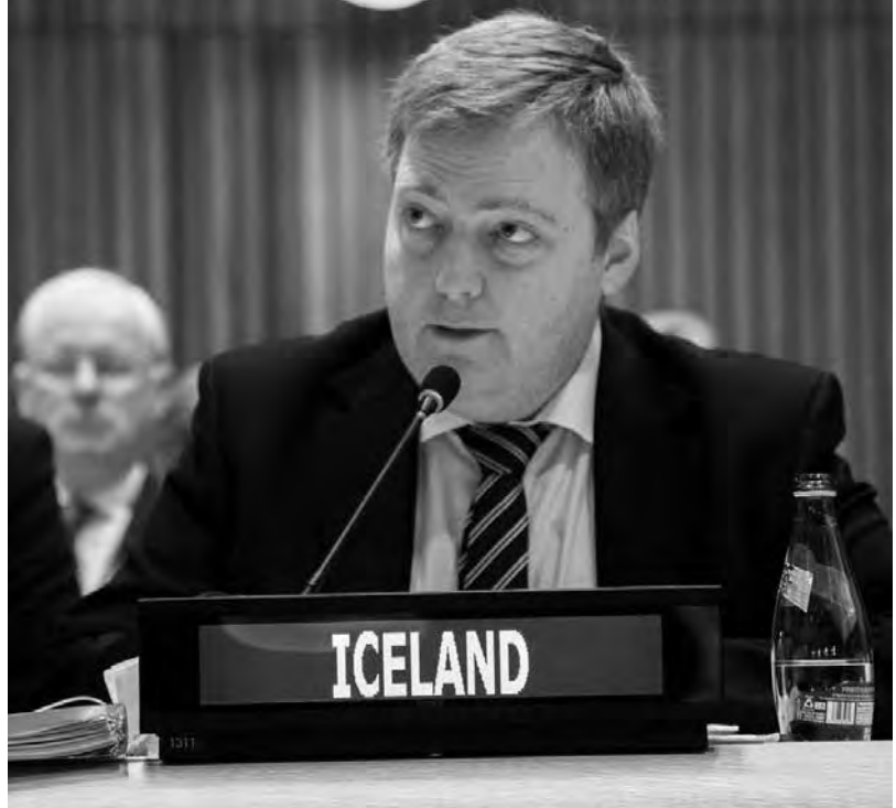
Primer Ministro de Islandia, Sigmundur David Gunnlaugsson

Lo que se ha convertido en un hecho noticioso de importantes dimensiones, tanto por el tema tratado (delitos fiscales