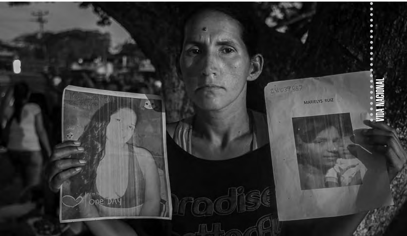
Masacre de Tumeremo