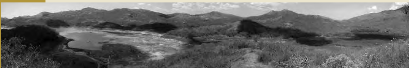
Panorámica de la pérdida del agua en el Embalse Guanapito