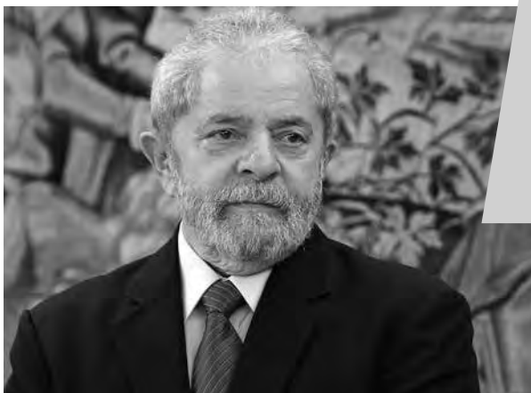
Lula da Silva.