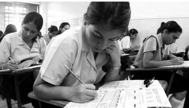
CANAL DE NOTICIAS

Imaginar un escenario en el que podamos revertir la situación actual y pensar en una solución duradera a la crisis debe requerir, además de seguridad jurídica y estabilización macroeconómica, el diseño e implementación de un proceso de reforma de la educación en y para el trabajo. Esta transformación debe venir a través de políticas educativas orientadas a promover una nueva cultura del trabajo y a favorecer la formación de trabajadores que con su entrega y dedicación posibiliten la reactivación de la capacidad productiva, la modernización tecnológica y la innovación.