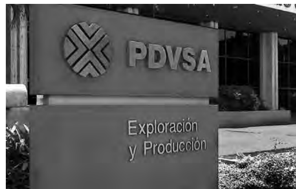
COTIZADOR DE SEGUROS

La situación es tan grave que Maduro ha decretado “amplias facultades” al ministro de Petróleos, el mayor general Manuel Quevedo, para efectuar cambios en la industria de los hidrocarburos y en las contrata-