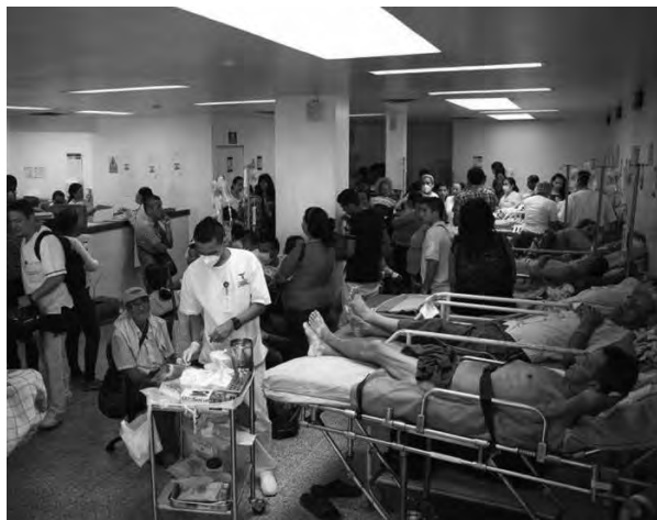
DIARIO LAS AMÉRICAS

La cantidad de profesionales de la salud que salieron de Venezuela en estos años se desconoce, pero el dato más cercano lo ofrece la Encuesta Nacional de Médicos y Estudiantes de Medicina 2017, divulgada en diciembre de ese año, que reveló que el 40 % de los egresados de las escuelas de medicina venezolanas durante la década pasada están en el extranjero.