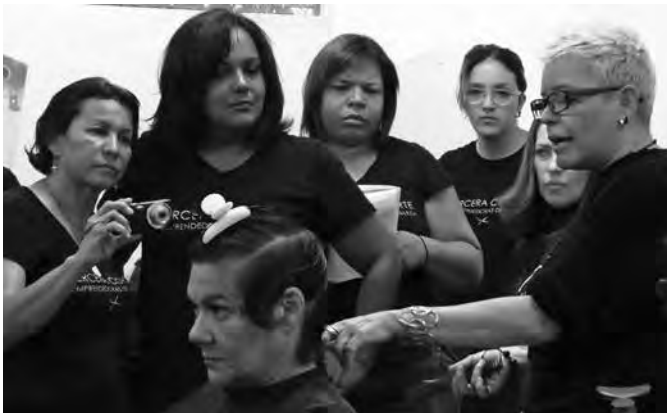
Clases del oficio.

*Miembro del Consejo de Redacción de SIC