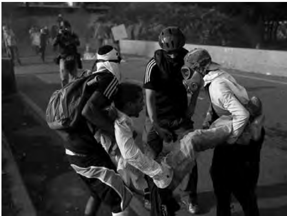
Represión en Venezuela.