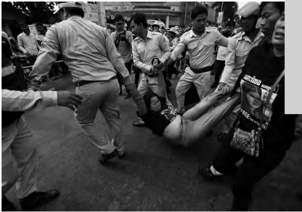
Represión en Camboya.