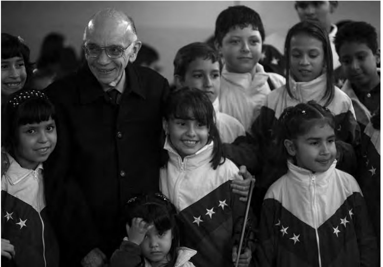
SISTEMA NACIONAL DE ORQUESTAS