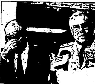
Alliego: "A la gente le gusta mezclar la chicha con la manzana"

la tarde. El ministro de Defensa restó importancia también, al vuelo hecho por aviones F-16 sobre Caracas, durante la madrugada del lunes. Informó de la investigación realizada sobre la movilización de tanques en los alrededores, de La Vinya y del MRI