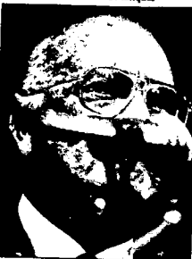
Lusinchi espera resultado de las investigaciones.

El Primer Mandatario sugirió que las circunstancias que rodearon lo ocurrido en El Amparo, constituyen una situación diferente a las informaciones que se han dado. Recalcó importancia a la movilización de tanques