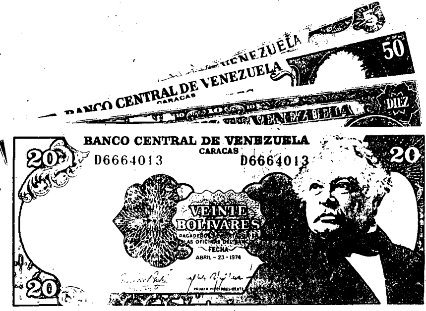
La devaluación necesaria

Aceptada la devaluación como inevitable y deseable, el problema polí-