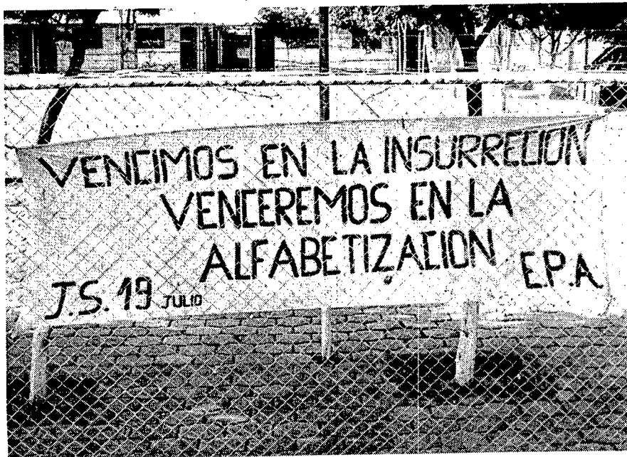
Propaganda del Ejército Popular de Alfabetización

En las otras lecciones la palabra se divide en sílabas, entre la cuales se elige