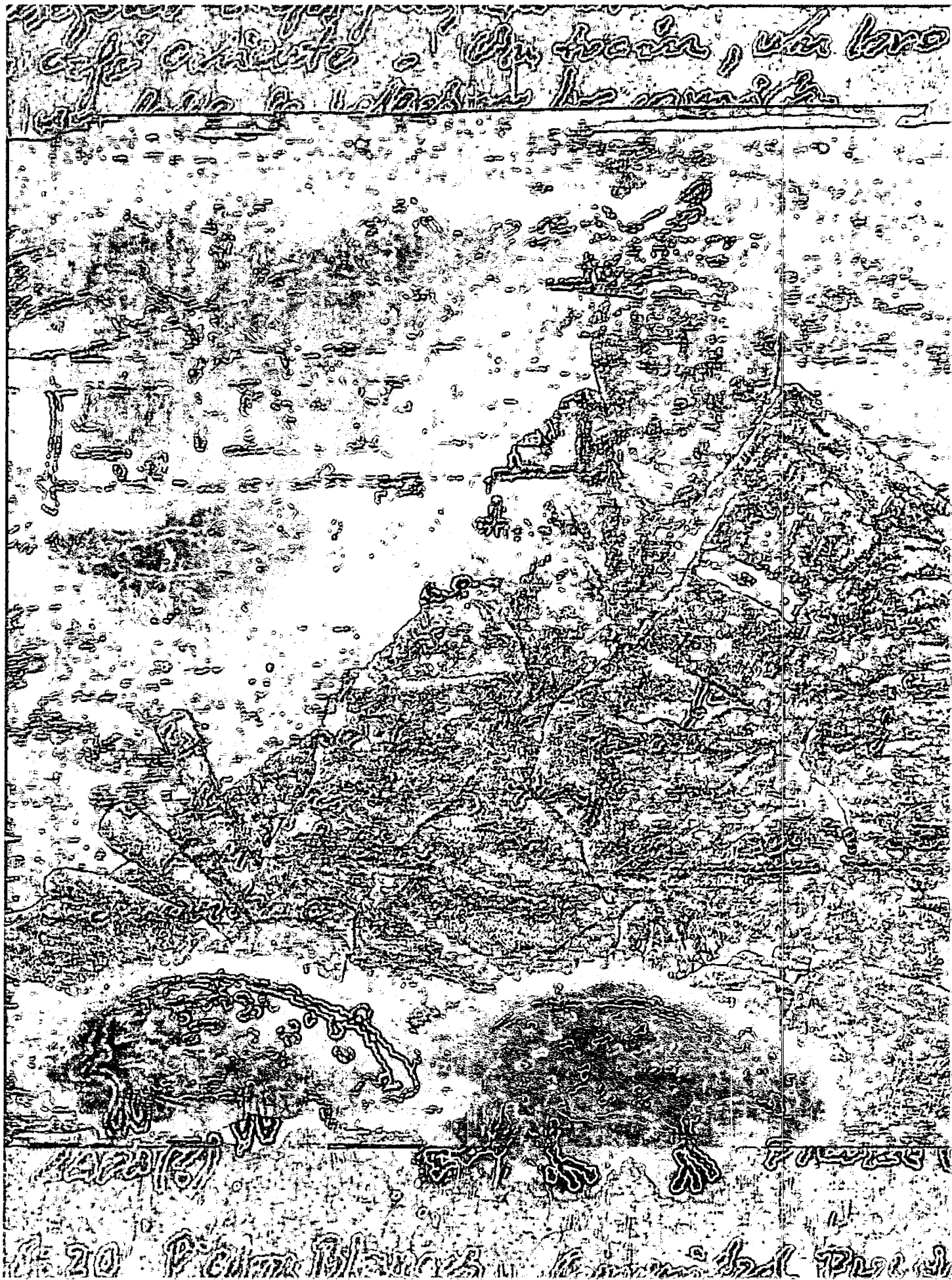
Galería de papel / Gold Sticks and Cachicamo Island. Rimer Cardillo (Uruguay)