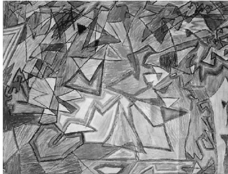
Obras de niños en liberación creativa