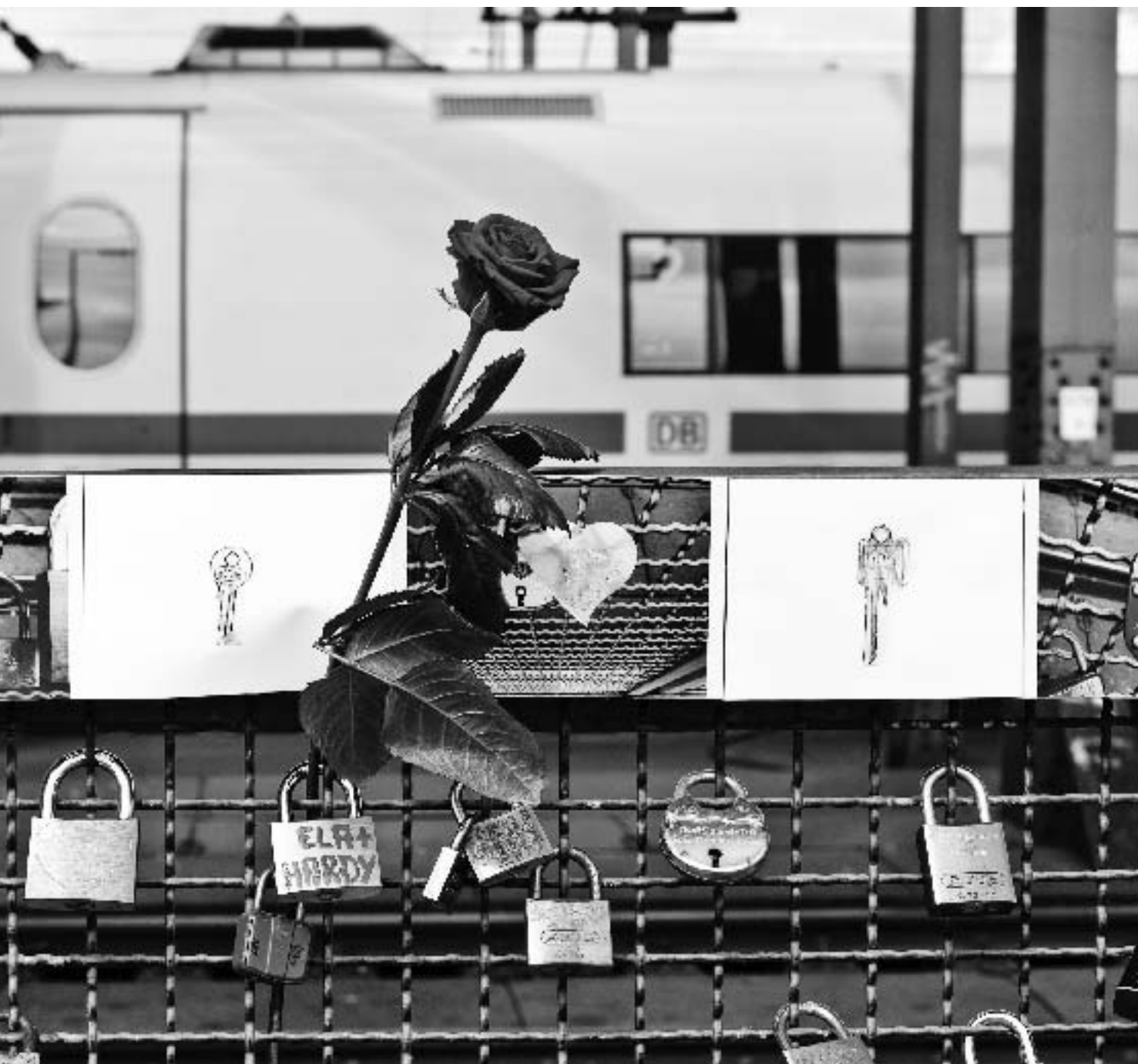
Galería de Papel. Rituale. Gertra Riechert.