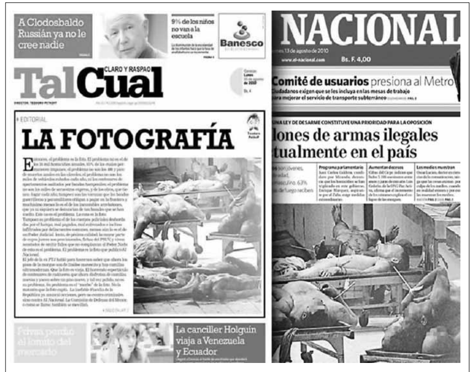
Fotografía N° 3