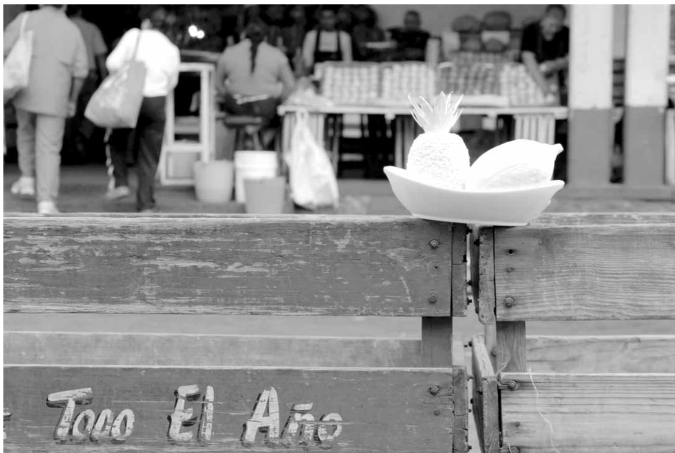
Galería de Papel. Augusto Marcano. Serie Dispara sin pólvora .