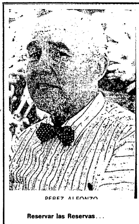
Reservar las Reservas...

Según las Cuentas elaboradas por el Banco Central de Venezuela, la Inversión Bruta Fija total sumó en el quinquenio 1968-1972 Bs. 61.357 millones. De esta cantidad, Bs. 19.802 millones fue inversión importada, mientras el resto Bs. 41.455 millones correspondió a la porción nacional (pública y privada). Esa importación de bienes de capital costó en divisas, $4.528 millones.