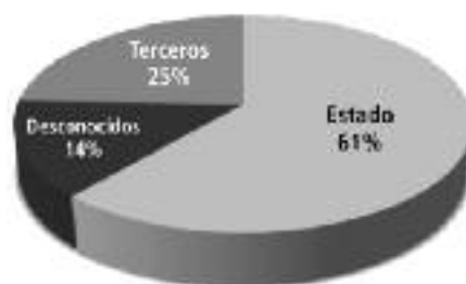
GRÁFICO. DENUNCIAS DE VIOLACIONES A LA LIBERTAD DE EXPRESIÓN POR VÍCTIMARIOS 2012

El Estado se caracteriza por violaciones utilizando herramientas legales o administrativas y por el hostigamiento verbal, que viene siendo una tendencia sostenida por funcionarios de gobierno a nivel nacional y regional, usualmente empleada como mecanismo de respuesta ante alguna crítica no bienvenida a la gestión de gobierno.