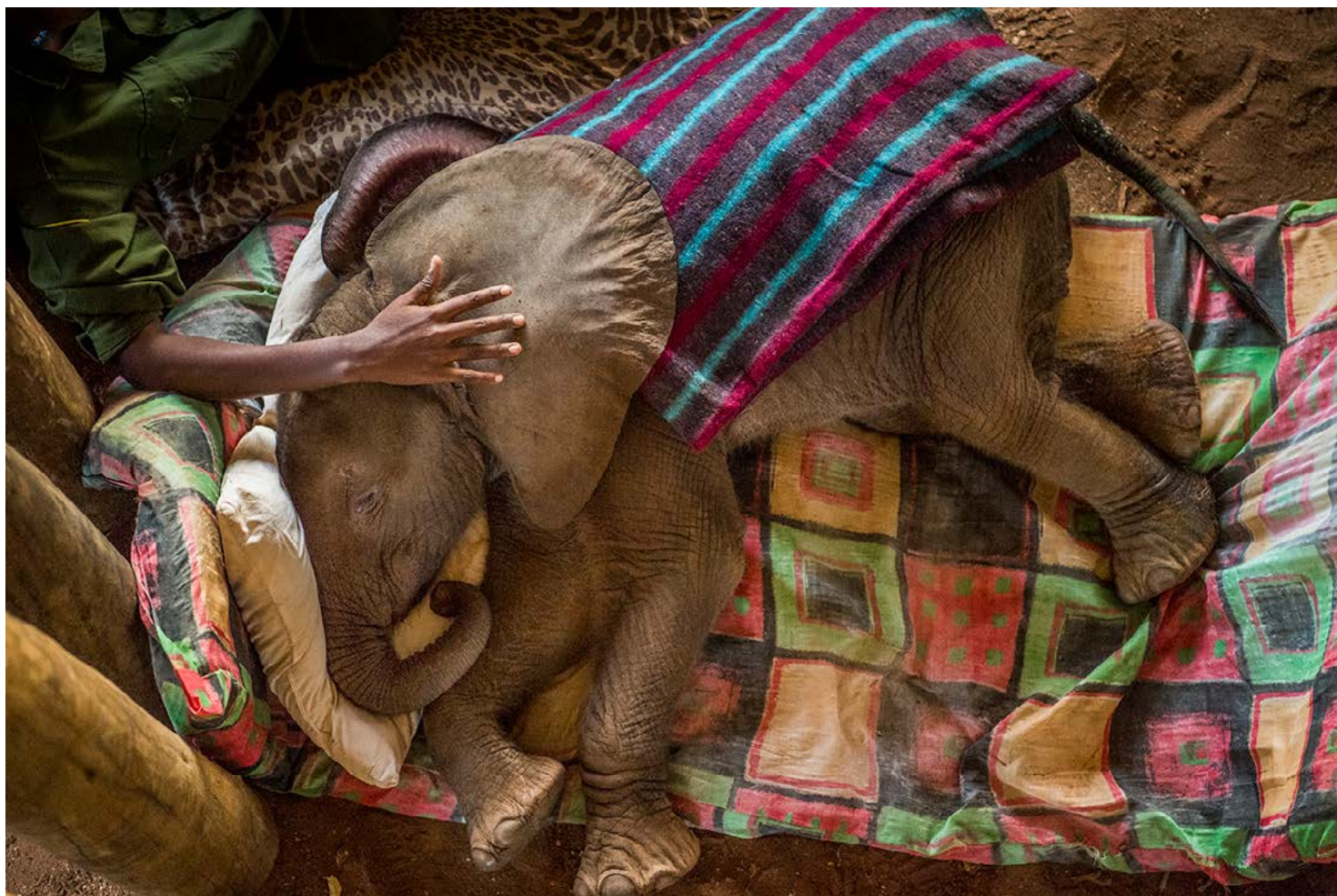
Galería de papel. World Press Photo-2018. Ami Vitale (National Geographic).